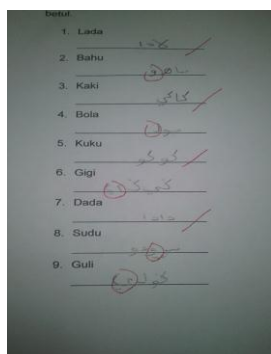
Lembaran Kerja Peserta A.

Sebelum penggunaan tanah liat pelbagai warna tersebut, peserta kajian sukar untuk menulis suku kata terbuka jawi dengan betul dan banyak melakukan kesalahan dalam penggunaan vokal jawi sama ada perlu menggunakan vokal jawi dalam suku kata tersebut atau tidak. Selain itu, mereka juga membuat kesalahan dalam penyambungan huruf vokal jawi walaupun lembaran kerja yang saya sediakan menggunakan tahap yang paling mudah. Namun demikian, masih terdapat peserta kajian yang melakukan kesalahan dalam menulis suku kata terbuka jawi tersebut. Dapatan kajian di bawah menunjukkan lembaran kerja yang ditulis oleh salah seorang peserta kajian saya.